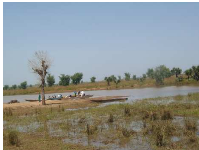
Prise de vue par Bouldai, le 26/10/2020