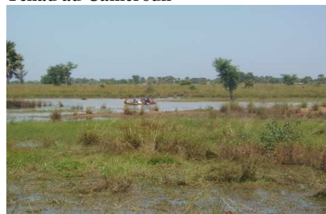
le 26/10/2020