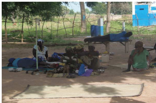
le 21/10/2020.

Ce difficile accès aux soins de santé pour les frères de l'autre côté n'est qu'un exemple parmi d'autres. Cependant, les populations venues du Tchad ne rencontrent pas uniquement