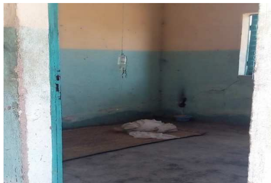
Prise de vue par Bouldai le 22/10/2020 à Kartoua

Les difficiles dispositifs sanitaires qui d'ailleurs sont insuffisants pour la population destinée, doivent cependant supporter également les besoins exprimés de l'extérieur. En effet, les migrations de santé sont les plus fréquentes dans le Mayo-Danay ce qui pousse certains personnels soignants à pratiquer du favoritisme, en mettant dans les poches de sa blouse son serment d'Hippocrate qui l'oblige à assister toute personne en danger sans distinction quelconque. L'accès aux Fosas devient complexe pour les malades étrangers, le social célébré plus haut dégage, laissant place à ce que les patients appellent « leurs frères d'abord et nous après. Si on va qu'à même prendre soins de nous on va se contenter du peu, pourvu qu'on n'est plus mal », affirme l'une des mamans couchées sur la photo ci-dessous. Ces tchadiens doivent cependant se contenter du peu qu'ils reçoivent, une AS nous l'a fait si bien remarquer dans une Fosa de la place, dans l'anonymat Dès son arrivée au centre, elle vint nous retrouver avec son collègue dans la salle d'accueil où nous étions en plein entretien. Se dirigeant vers les deux salles d'hospitalisation dont dispose l'hôpital et où l'on retrouve les